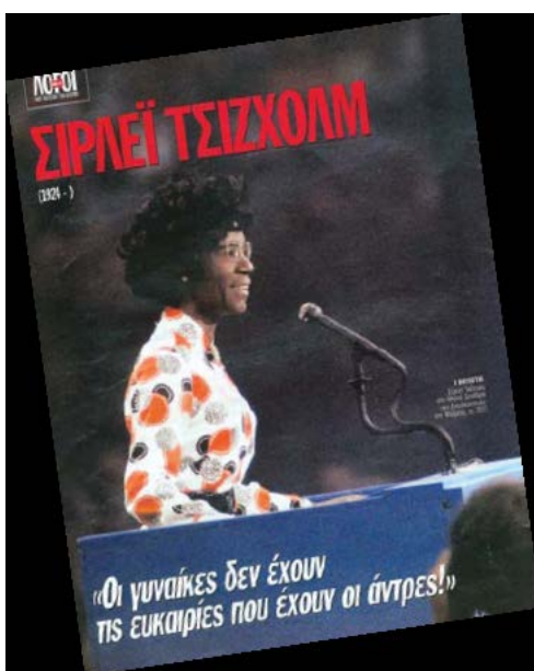
Εικόνα 1. (Νεοελληνική Γλώσσα Γ΄ Γυμνασίου: 48).

Σημείο έναρξης της διδασκαλίας είναι η εξοικείωση με το θέμα του κειμένου, ο τρόπος που συνδέεται με την κοινωνία και τα κοινωνικά τεκταινόμενα, με αξιοποίηση των προηγούμενων γνώσεων και των ενδιαφερόντων των μαθητών μέσα από συζήτηση. Η εικόνα που συνοδεύει το κείμενο (εικόνα 1) αποτελεί έναυσμα για μια πρώτη κατάθεση απόψεων των μαθητών με την τεχνική του καταγισμού ιδεών.