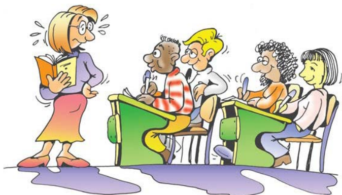
Εικόνα 3. (Νεοελληνική Γλώσσα Γ΄ Γυμνασίου: 52).

-Να παρατηρήσετε την εικόνα στη σελίδα 52 του βιβλίου σας (εικόνα 3) και να αναφέρετε ποια είναι η αντίδραση της δασκάλας, όταν αντικρίζει τους μαθητές της. Για ποιο λόγο θεωρείτε ότι αντιδρά με αυτόν τον τρόπο; Ποια είναι η δική σας γνώμη για την αντίδραση αυτή;